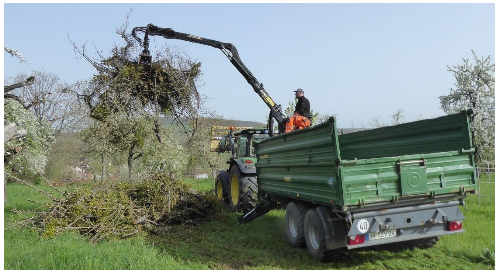
Schnittgutentsorgung mit Ladekran