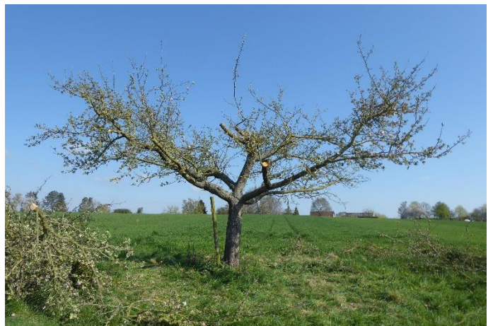
Mistelentnahme bei mittlerem Befall