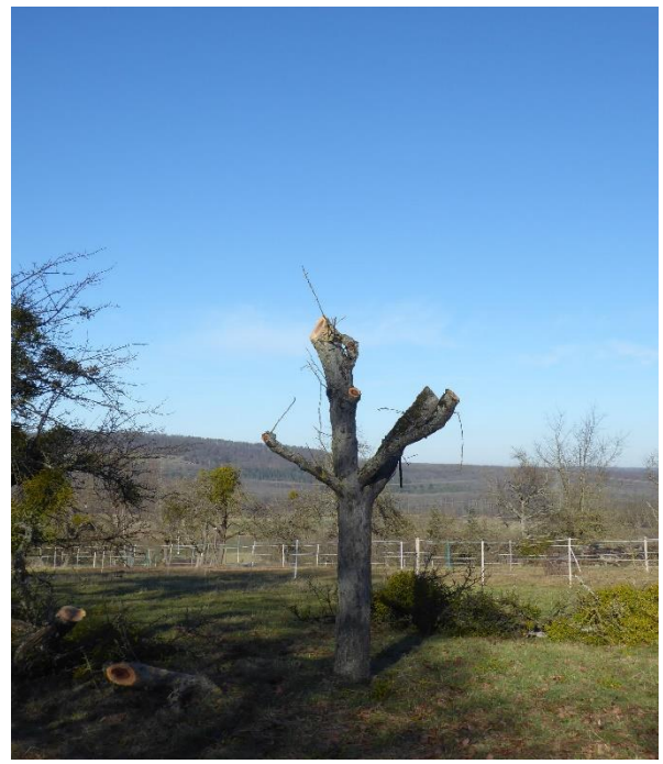
Schnitt von Apfelbaum mit Vollbefall zu Rumpfbaum