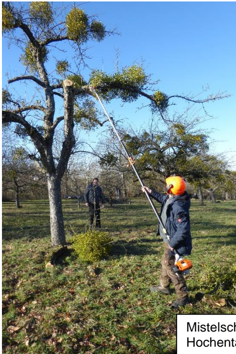
Mistelschnitt mit Hochentaster