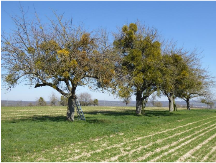
Apfelbäume mit starkem Mistelbefall