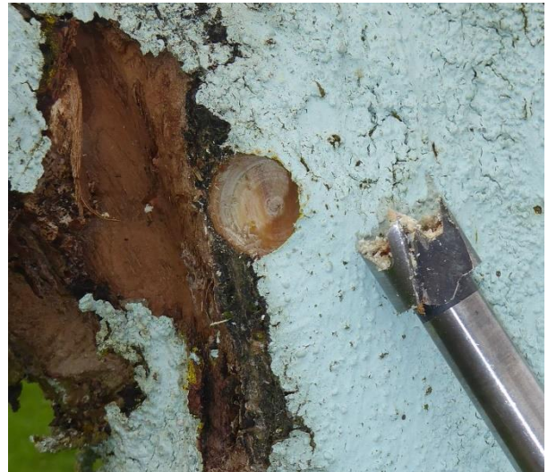
Mistelkeimlinge ausbohren mit Forstnerbohrer